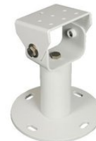
500-0463-00 Adattatore per installazione pendente