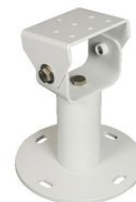
500-0463-00 Adattatore per installazione pendente