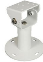
500-0463-00 Adattatore per installazione pendente